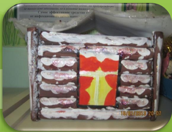
Из бумаги и ваты?