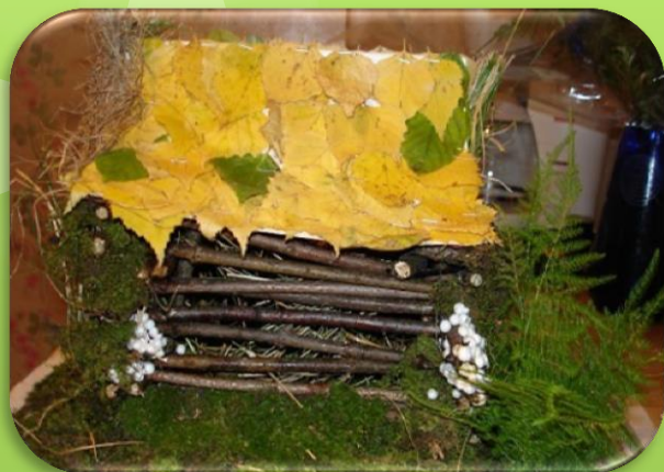
Из мха и веток?