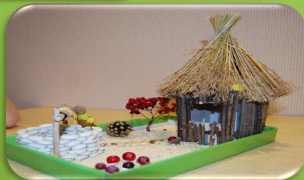
Из соломы и веток?